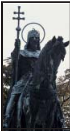
Szent István Király

Mind a Segélyegylet (mint a magyar Szeretebál rendezője), mind a Szent Gellért kolostor és a Szent István Király Templom (Szent István ünnepélyek rendezői) büszkéek lehetnek arra, hogy ezt a lehetőséget megad-