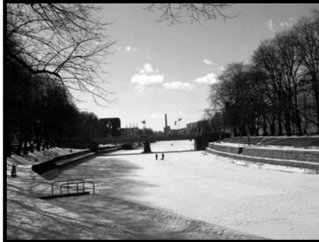
A befagyott Aura folyó

Finnország világviszonylatban is talán a legönnellátóbb nemzetgazdaság, kitűnő termelőképességgel, a korrupció minimális, a környezetvédelem nagyon szigorú, az alapoktatási szintje első helyen áll, és a felsőoktatás nagyon magas színvonalú. Az egy főre eső jövedelem egyike a legmagasabbaknak (legalább is az ENSZ megbízásából készült életszínvonal-