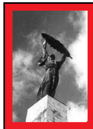
A Szabadság-szobor a Gellért-hegyen

Forradalomra, szabadságharcra emlékeztünk márciusban nemzeti ünnepünk alkalmából. A 2006-os év igen jó alkalmat ad arra, hogy a szabadság fogalmáról elmélkedjünk: az 1956-os forradalom és szabadságharc 50. évfordulóját ünnepeljük. Ez évi számainkban több ízben is megemlékezünk majd Magyarország történelmének ezen fontos, sorsdöntő eseményéről. Rónai Egon 1956 októberében így foglalta gondolatait rímekbe a szabadságról, melyre végül még évtizedeket kellett várni.