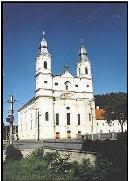
Mária-kegytemplom Csíksomlyón - Erdély leghíresebb műemléke. Benne található az 1515 körül készült Csíksomlyói Madonna

Az első csíksomlyói templomot 1442-48-ig építették gótikus stílusban, a törökverő Hunyadi János marosszentimrei győzelme emlékére, de csak 1567. Pünkösöd szombatjától vált búcsújáró helyé, egy közelben lezajlott csata után. A mai templomot 1804 és 1876 közt építették az előbbi helyére barokk stílusban. A templom legnagyobb értéke a Csíksomlyói Madonna, amely 1515 körül készülhetett; egy helyi mester faragta hársfából a 2,2 méter magas művet. A nép hite szerint, ha vész közelgett, a Madonna könnyezni kezdett. Másik legenda azt meséli, hogy egy tatárbetörés alkalmával a tatárok minden csíki falut fölégettek és sokan menekültek Somlyóra. Amikor a templomban egy tatár a lándzsájával próbálta a szobrot ledönteni, a karja megbénult. Érdekes hogy a sok betörés és háború ellenére ötszáz éven keresztül megmaradt.