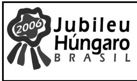
A Jubileumi év hivatalos jelképe

A felkérés olyan visszhangra talált, amely magasan felülmúlta a