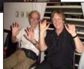
Tánc és multság a Táncházban